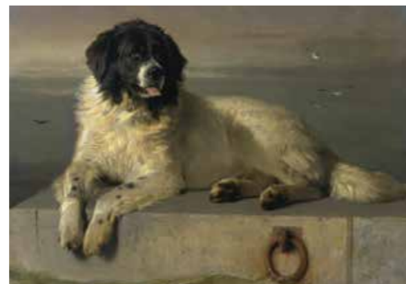
Rechts Der Maler Sir Landseer verewigte die schwarz-weißen Wasserhunde aus Neufundland in seinen Gemälden und wurde dadurch Namensgeber für die relativ junge Rasse.

So ging es Sundari Grünenfelder, glückliche Besitzerin der zehn Monate alten Portugiesischen Wasserhündin (kurz PWD oder Porti genannt) «Sayen da Buba».